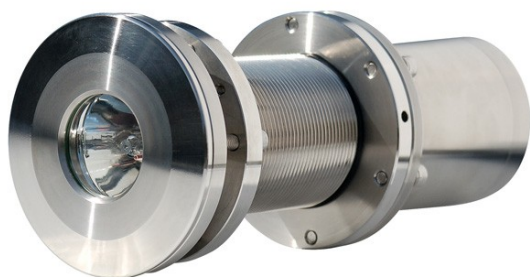
UNDERWATER BOAT HID XENON